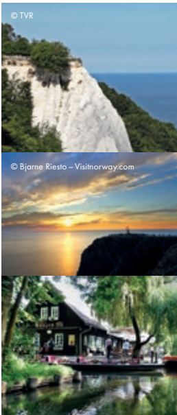
Titelbilder – Shutterstock.com